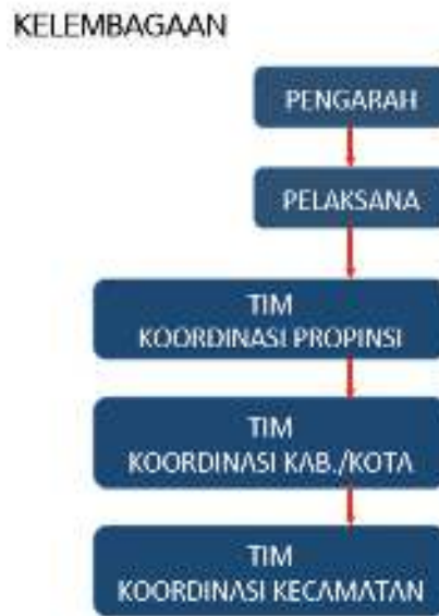
Diagram 2 Struktur Kelembagaan

Pengarah diampu oleh Menko PMK dengan anggota: Menteri PPN/Bappenas, Menkeu, Mendagri, Mendes PDTT, dan Menteri terkait lainnya.