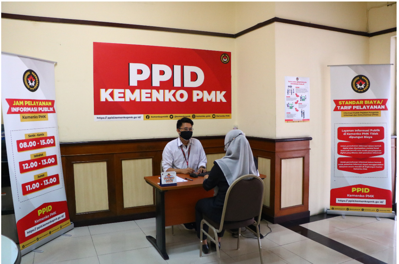
Gambar 2. Petugas PPID dan Pemohon Informasi di Kemenko PMK

Untuk menunjang pelayanan informasi dan dokumentasi maka PPID Kemenko PMK telah menyiapkan beberapa jenis penunjang administrasi untuk memudahkan pelayanan informasi kepada pemohon informasi publik. Adapun hal-hal dimaksud antara lain adalah :