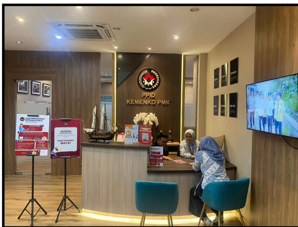
Area Ruang PPID Kemenko PMK